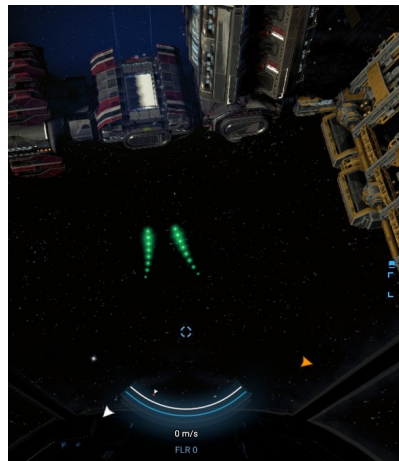
folge der Markierung